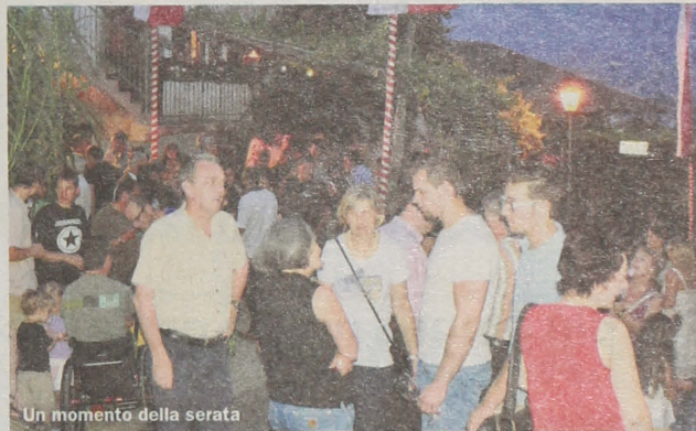
Un momento della serata